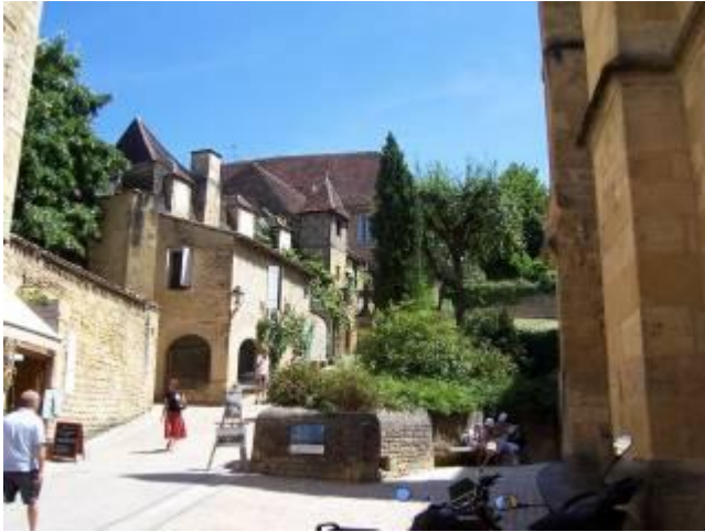
Casa (Maison) de La Boétie de estilo renacentista que viera nacer al escritor Étienne de La Boétie