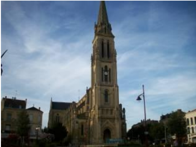
Iglesia de Notre Dame

Como en muchos sitios en Francia hay memoriales a los caídos en las guerras como el que aquí se ve en recuerdo de los que hubo en la contienda entre este país y Prusia